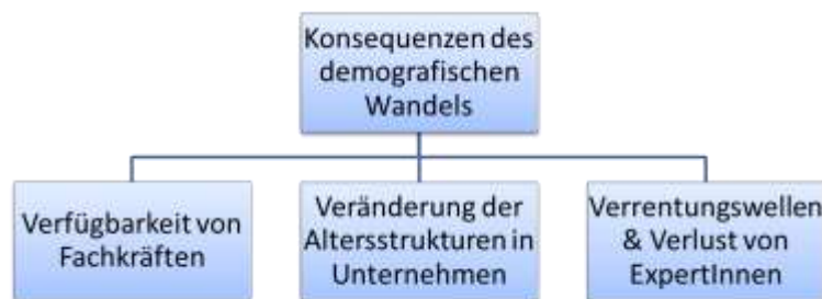
Abbildung 2 Drei Hauptkonsequenzen des demografischen Wandels für Unternehmen

Auf Grundlage der mittlerweile vielfältigen Literatur zu der Bedeutung des demografischen Wandels für Unternehmen (z.B. Bruch & Kunze, 2007; Bruch et al., 2010; Buck et al., 2002; Bullinger & Buck, 2007; Deller, Kern, Hausmann, & Diederichs, 2008; Fischer, 2007; Frerichs & Sporket, 2007; Juch, 2009; Oertel, 2007; Prezewowsky, 2007; Schwarz & Hipp, 2007; Spannring, 2008) lassen sich drei miteinander verbundene Hauptkonsequenzen ableiten. Diese werden in Abbildung 2 präsentiert und nachfolgend näher erläutert.