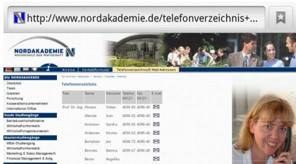
Abbildung 2 Telefonliste