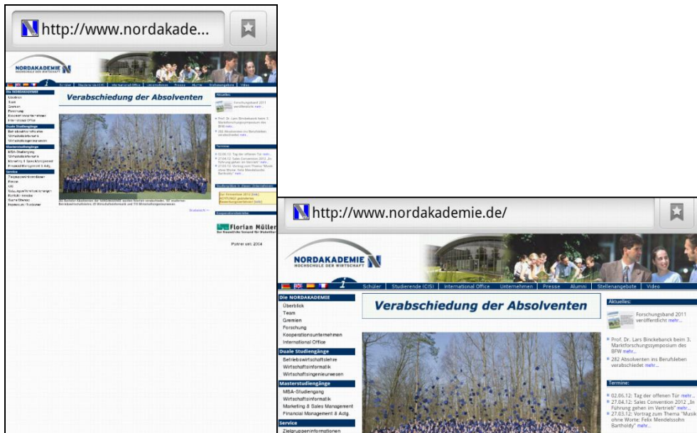
Abbildung 1: Nordakademie-Startseite im Portrait- und Landscape-Format