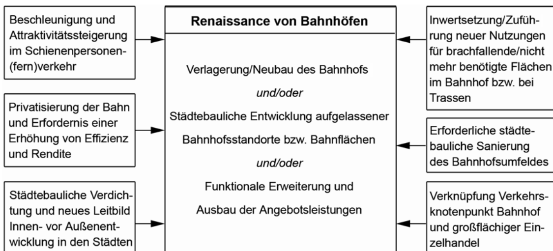
Abb. 1: Aktuelle Determinanten der Entwicklung von Bahnstandsstandorten