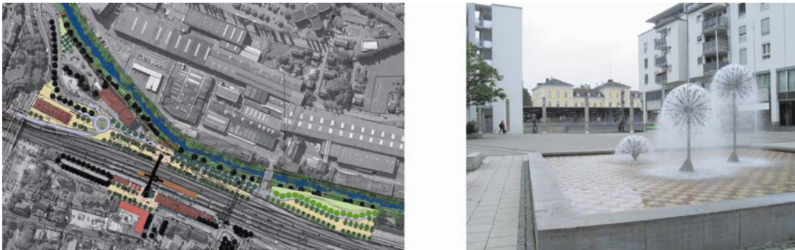
Abb. 8: Städtebauliche Sanierungsplanung Bahnhof und Bahnhofsumfeld Ravensburg (links) und realisierte Bahnhofsumfeldsanierung Friedrichshafen (rechts)