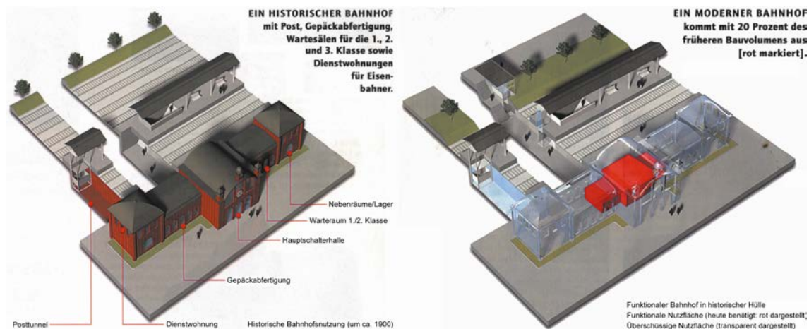
Abb. 4: Veränderung der Kernnutzung an Bahnhöfen