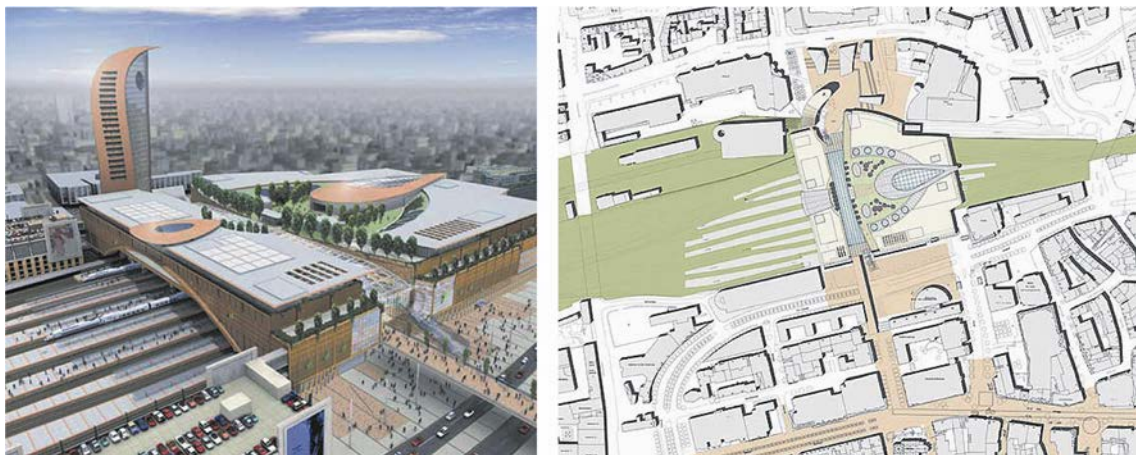
Abb. 7: Montage und Rahmenplan zum Projekt Dortmund 3do