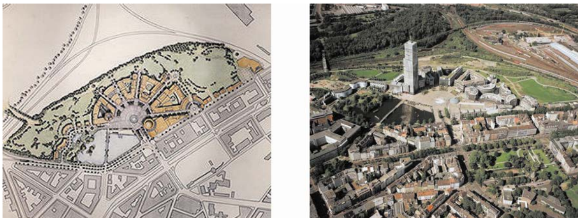
Abb. 2: Städtebaulicher Entwicklungsplan und Luftbild zum MediaPark Köln