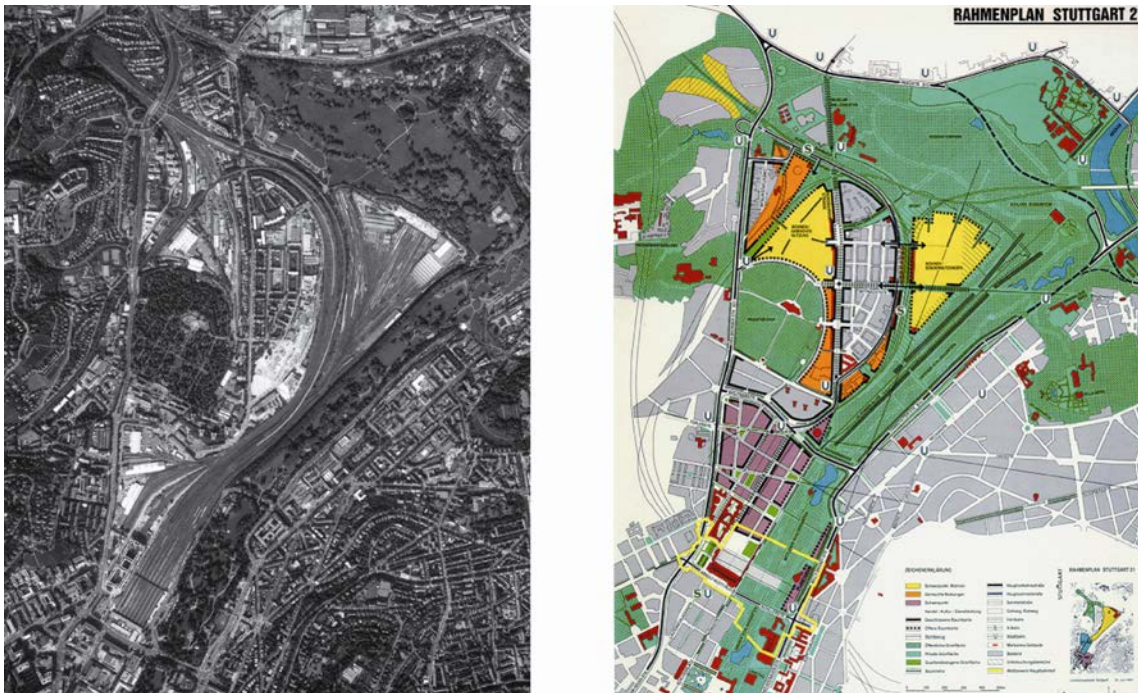
Abb. 6: Stuttgart 21 – Luftbild zum Bahnhof und Bahnhofsumfeld, Städtebaulicher Rahmenplan