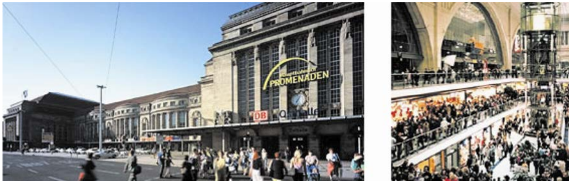
Abb. 5: ECE-Shopping Center in Leipzig