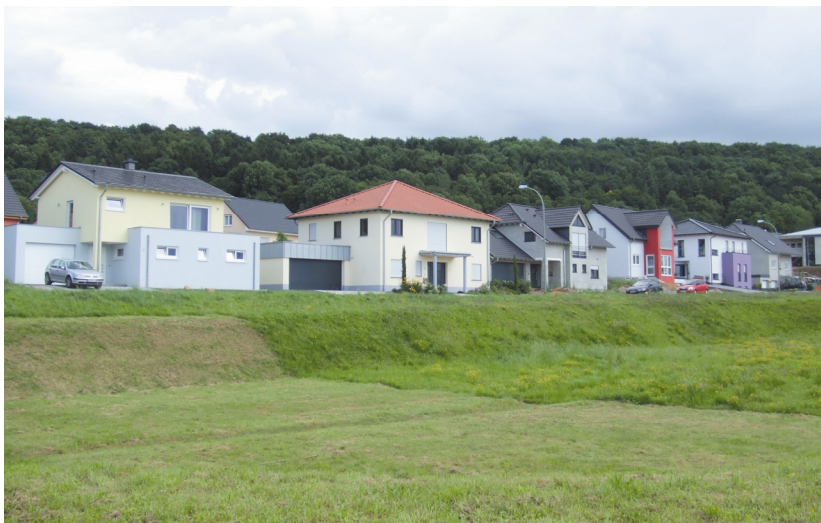
Abb. 3: Neubaugebiet in Perl

Besonders betroffen von der Zuwanderung durch Luxemburger ist die Grenzgemeinde Perl im Landkreis Merzig-Wadern. Hier entstanden in den letzten Jahren viele Neubaugebiete für die zugezogenen Luxemburger (vgl. Abb. 3). Perl grenzt an das französische Département Moselle (Apach im Süden) und Luxemburg (Schengen im Westen). Die Gemeinde Perl weist mit 100 Einwohnern pro km 2 die niedrigste Bevölkerungsdichte im gesamten Saarland auf (Statistisches Amt Saarland 2010).