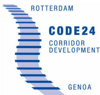
Abb. 3: Logo des Projekts CODE 24

Vor dem Hintergrund der Situation und der Herausforderungen im Schienenverkehrskorridor zwischen Rotterdam und Genua wurde zu Beginn des Jahres 2010 im Rahmen des INTERREG-IVB-Programms der Europäischen Union das multinationale Projekt „CODE 24“ gestartet, wobei das Akronym für COrridor DEvelopment 24 steht (vgl. Abb. 3).