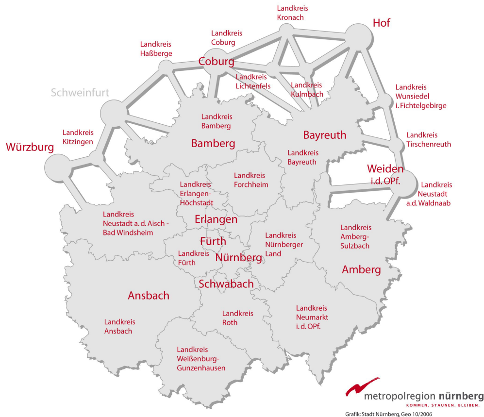
Abb. 5: Europäische Metropolregion Nürnberg

Der oben beschriebene metropolitane Kern der Europäischen Metropolregion Nürnberg (EMN) entspricht weitgehend dem Gebiet des Verkehrsverbundes Großraum Nürnberg. In der Ausformung des Verkehrsverbundes spiegeln sich die konkreten sozio-ökonomischen Verflechtungen wider, die eine hervorragende Grundlage für die Zusammenarbeit in der Metropolregion bilden.