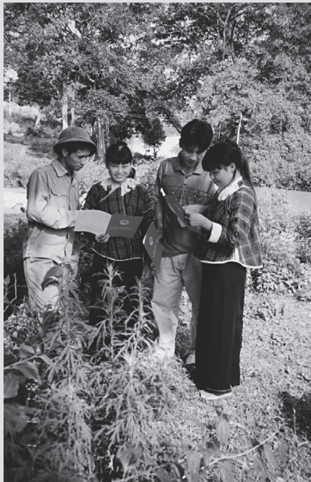
Abbildung 5: Vietnamesische Kleinbauern mit »Red Book Certificate«. GFA Terra Systems GmbH

Bezug zum CDM (I): In den Bewirtschaftungsverträgen ist die Aufforstung mit Pinus massoniana festgeschrieben. Insgesamt ist eine Aufforstungsfläche von 2900 ha vorgesehen. Diese sich aus Teilflächen von wenigen Hektaren zusammensetzende Gesamtfläche reicht aus, um insgesamt ein Volumen an CERs zu generieren, welches für Käufer attraktiv sein kann. Die durch die KfW geleisteten Beträge für die Bauern und das Projektmanagement könnten durch zusätzliche Flächen sichergestellt werden, für die zur Zeit nicht ausreichend Mittel zur Verfügung stehen. Es wird herausgestellt, dass durch die Einrichtung der Sparbücher ein außergewöhnlich hoher Prozentsatz der Projektfinanzierung direkt an die involvierte Bevölkerung ausgezahlt wird.