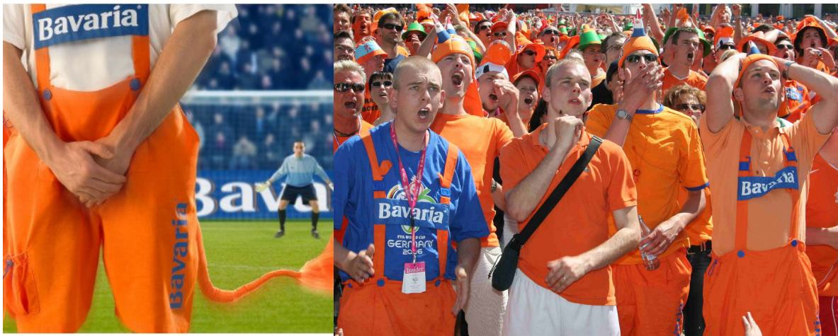
Abb. 1: Beispiel für Ambush Marketing

ten, brachten die Medien großes Interesse entgegen – so dass die Aktion vermutlich weniger Aufmerksamkeit erregt hätte, wenn das FIFA-Team sie nicht unterbunden hätte. 8