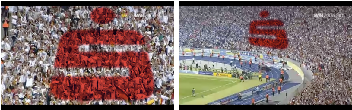
Abb. 4: Umsetzung der visuellen Montagen