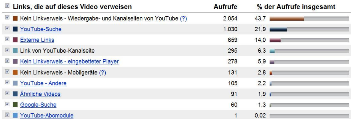
Abbildung 2: Zugriffspunkte auf den ESB-Flashmob

Wie Abbildung 2 zu entnehmen ist, wurden über 43% der Aufrufe durch die virale Verteilung der Linkadresse, z.B. via E-Mail oder Erwähnungen des Links in Messengern, generiert. Alle anderen Zugriffe auf das Video sind nachvollziehbar und stellen die Minderheit dar. 14% der Aufrufe wurden durch Zugriffe von externen Links gemacht, hinzu zählen Facebook und StudiVz, die zusammen über 70% der externen Links ausmachen.