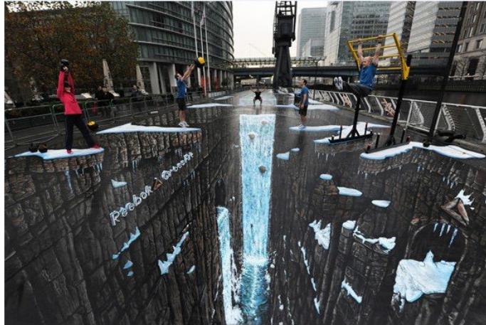
Abb. 8: Ambient Stunt von Reebok