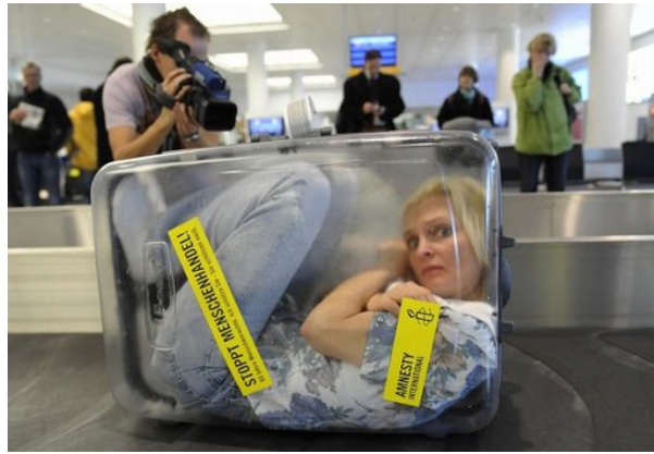
Abb. 5: Guerilla Sensation von Amnesty International