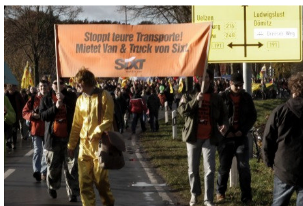
Abb. 6: Guerilla Sensation von Sixt

Auch die Autovermietung Sixt erregt regelmäßig durch ihre Marketing-Aktionen Aufmerksamkeit. Bei einem Castor-Transport im Jahre 2010 mischten sich einige Sixt-Mitarbeiter unter die im Wendland demonstrierende Masse. Dabei hielten sie Schilder mit dem Aufdruck "Stoppt teure Transporte! Mietet Van&Truck von Sixt!" hoch. Dies stieß zwar teilweise auf erhebliche Kritik seitens der Bevölkerung; nichtsdestotrotz lobte Sixts Kommunikationsabteilung im firmeneigenen Blog diese Aktion, die "kostengünstig gefilmt, dokumentiert und (...) von der zahlreich erschienenen Presse" 22 verbreitet wurde. Dies stellt nicht nur ein hervorragendes Beispiel für eine Guerilla Sensation-Aktion dar, sondern veranschaulicht gleichzeitig den Multiplikatoreffekt durch PR sowie die mögliche negative Reaktion der Bevölkerung auf Sensation Marketing-Aktionen.