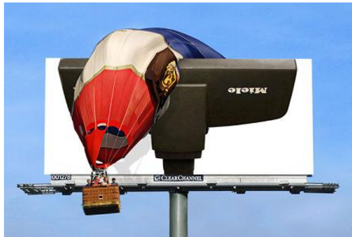
Abb. 2: Sensation Marketing von Miele