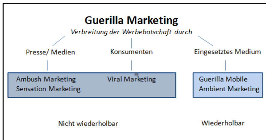
Abb. 4: Klassifizierung der Guerilla-Marketing-Instrumente

Es besteht eine unverkennbare Ähnlichkeit zwischen dem Ambient Stunt und dem Ambient Marketing. Der Hauptunterschied liegt hier darin, dass Ambient Marketing beliebig wiederholbar ist und flächendeckend eingesetzt werden kann, Ambient-Stunt-Installationen jedoch relativ schnell einem Wear-Out-Effekt unterliegen und auch nur punktuell eingesetzt werden. 15