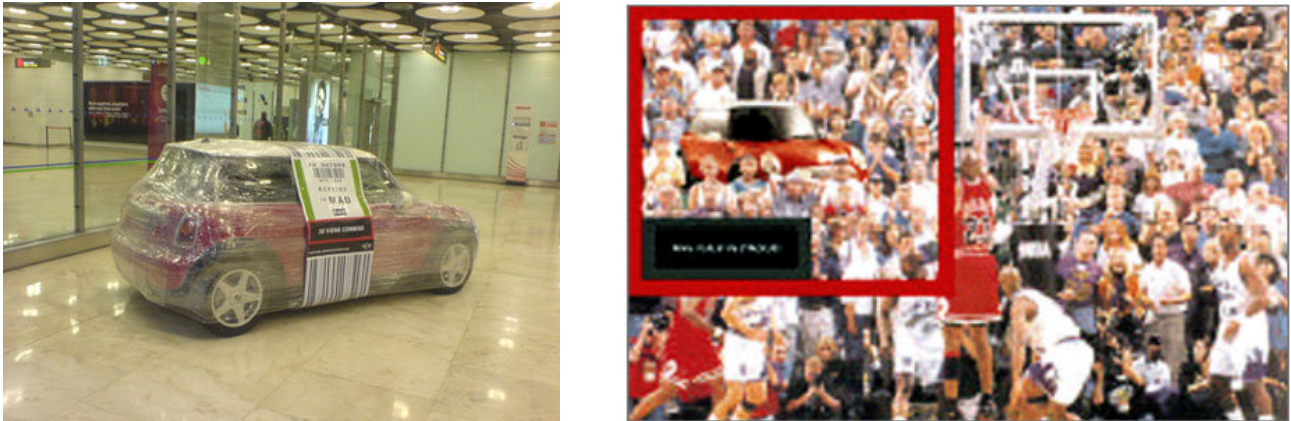
Abb. 3: Sensation Marketing von Mini