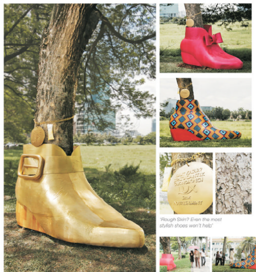
Abb. 7: Ambient Stunt von Lux

So wollte beispielsweise der Konsumgüterhersteller Lux seinen indonesischen Kundinnen bewusst machen, wie wichtig die Hautpflege für das gesamte Aussehen einer Frau ist. Dazu platzierte das Unternehmen in Jakarta überdimensionale Schuhe an Baumstämmen. Über dem Schuh befand sich eine Kette, auf deren Anhänger stand, dass selbst die schönsten Schuhe es nicht schaffen würden, trockene Beine gut aussehen zu lassen. Laut eigenen Angaben von Lux schaffte es dieser Ambient Stunt, in Jakarta teilweise den Verkehr lahmzulegen und bescherte dem Unternehmen hunderte von Erwähnungen in den Medien.