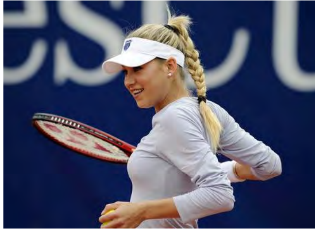
Abbildung 4: Anna Kournikova

Ein weiterer wesentlicher Bestandteil ist das Verhalten des Sportlers auf dem Spielfeld . Möchte der Sportler sich als Vorbild profilieren, so fängt die Umsetzung beim Verhalten und der Einstellung auf dem Spielfeld an. Umgekehrt kann ein Sportler in seltenen Fällen auch aus unsportlichem Verhalten Kapital schlagen, solange das Verhalten authentisch und konsistent ist, wie z.B. der ehemalige Tennisstar John McEnroe gezeigt hat. 25