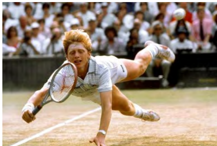
Abbildung 3: Boris Becker

Ausgangspunkt des operativen Markenmanagements ist die sportliche Leistung des Sportlers und daraus abgeleitet der sportliche Erfolg . Herausragende sportliche Leistungen zu bringen, sich gewissermaßen ins Rampenlicht zu spielen, ist Voraussetzung dafür, das Interesse der Zielgruppen zu wecken. So gelangte beispielsweise Boris Becker (vgl. Abbildung 3) mit seinem "Underdog-Sieg" in Wimbledon 1985 über Nacht zu Weltruhm. Erfolgsgeschichten wie diese lassen sich exzellent vermarkten.