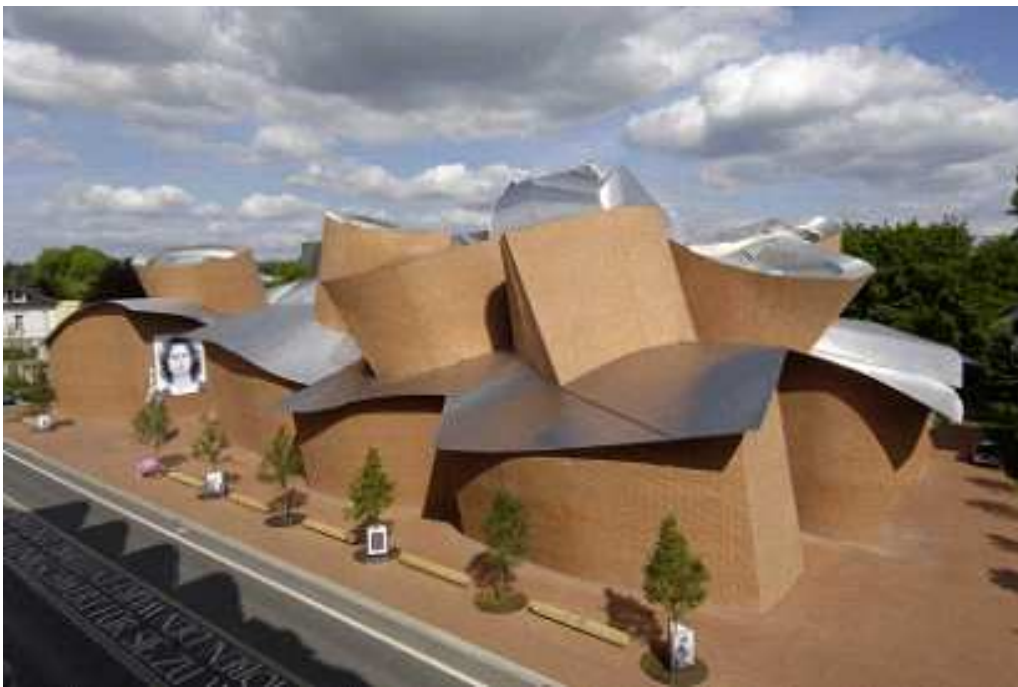
Foto 2: MARTa Herford, Außensicht, Fotograf: Thomas Mayer, Copyright MARTa Herford

der Plan, das Möbeldesign mit moderner Kunst zu vermischen und als Ausstellungskonzept für die breite Öffentlichkeit zugänglich zu machen.