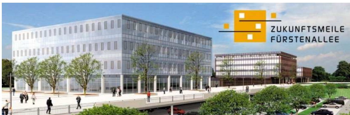
Illustration 1: Konzept der "Zukunftmeile Fürstenallee", Quelle: www.zukunftsmeile-fuerstenallee.de

Der Sprung vom Einzelgänger zum Netzwerker in Bezug auf die aktive Gestaltung der Außenwahrnehmung der Region OWL kann gut anhand des dritten Projektes ‚Zukunftsmeile Fürstenallee‘ veranschaulicht werden. Ausgangspunkt der Idee war eine gemeinsame regionale Vision der Akteure den wirtschaftlichen regionalen Themenschwerpunkt vom Handwerk auf Technologie und Innovation zu legen. An dem sich noch in Startposition befindenden Projekt beteiligen sich Partner nicht nur auf kommunaler und lokaler, sondern auch auf regionaler Ebene. Diese sind aber nicht nur durch ihre Verortung von den vorigen beiden Projekten zu unterscheiden, sondern auch durch ihre Heterogenität. Unter den Initiatoren befinden sich sowohl KMU als auch international bekannte Großunternehmen, die mit der regionalen Wissenschaft und Politik eng kooperieren. Darüber hinaus sind in dem Projekt regionale Universitäten und wissenschaftliche Institutionen vertreten, die gemeinsame Aktivitäten anstreben. Im Rahmen der ‚Zukunftsmeile Fürstenallee‘ sind Projekte mit internationalen Akteuren geplant, die neue Einblicke in die Region OWL als innovative und wettbewerbsfähige Region bieten sollen.