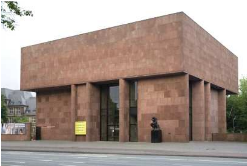
Foto 1: Kunsthalle Bielefeld, Außenansicht, Fotograf: Philipp Ottendörfer

Schenkung an die Stadt Bielefeld werden unter der Prämisse, zugleich ein Denkmal zu Ehren des verstorbenen Vaters des Großunternehmers darzustellen. Der Stadtrat wiederum erhoffte sich mit dem Bau großes regionales, aber vor allem überregionales Aufsehen zu erlangen, das eine damals wenig bekannte Stadt wie Bielefeld wahrnehmbar machte.