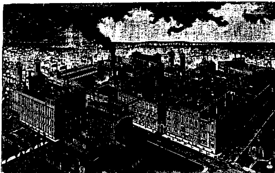
Abbildung 3 Deutsche Kultur im Chicago der Jahrhundertwende: Skat, Bier, Kladderadatsch

Telephone 4383 für PABST BREWING COMPANY'S FLASCHENBIER . In Quart- und Pint-Flaschen für Familiengebrauch . Chicagoer Zweigggeschäft: Ecke von Indiana- und Desplaines-Strasse. H. Pabst, Geschäftsführer.