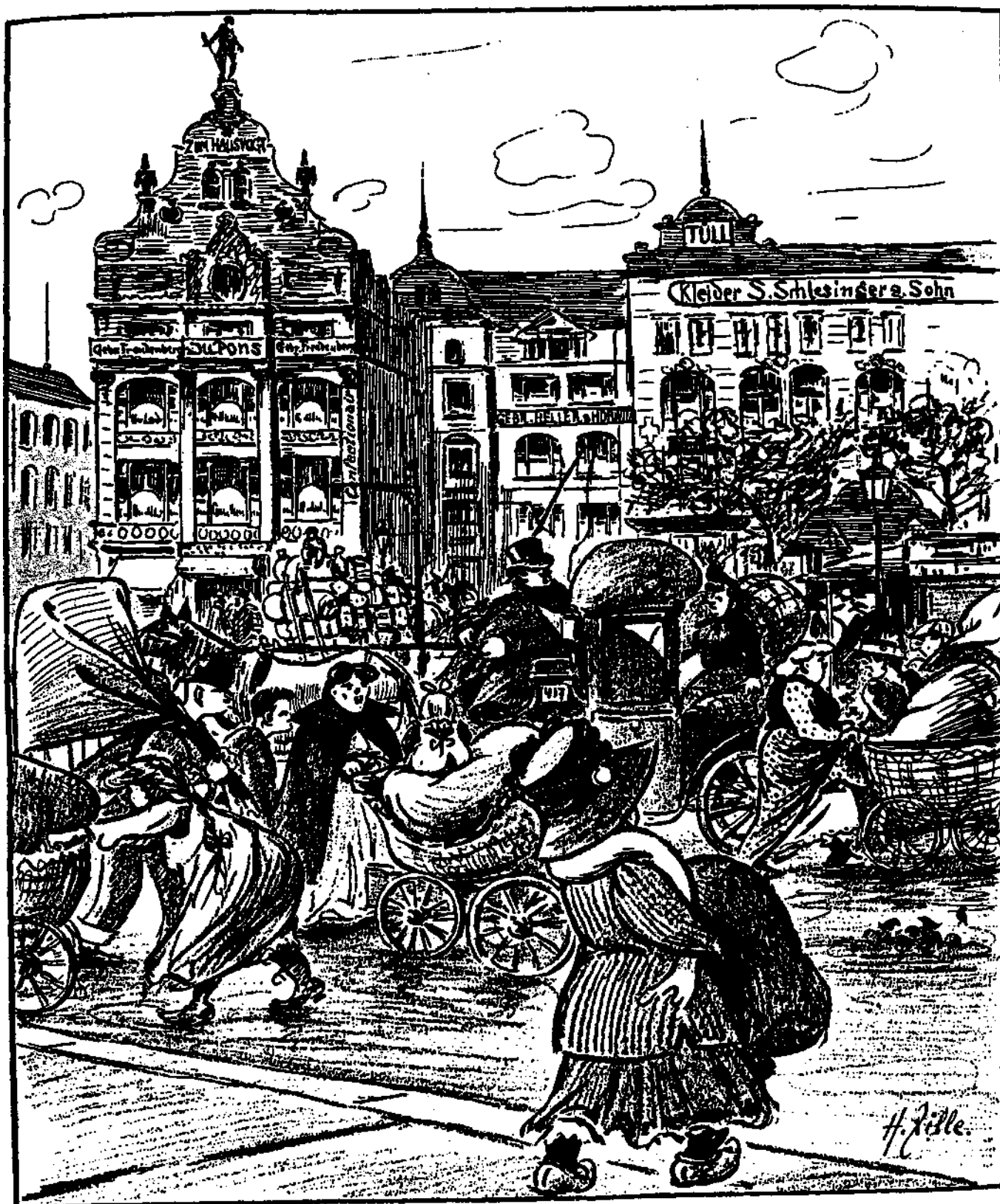
Abbildung 4 „Brausen der Weltstadt“, Hausvogteiplatz um 1910

Nr. 234 Koro am Hausvogtei platz um 1910