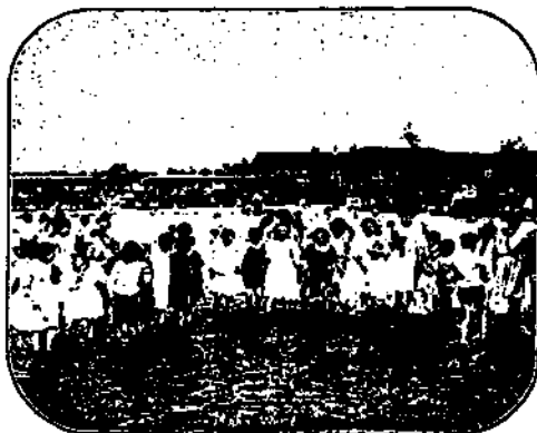
Planschwiese (im Hintergrunde das öffentl. Gesellschaftshaus).