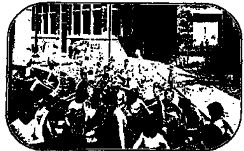
Sonnen- und Sandbad.