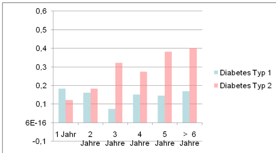
Abbildung 1: Z-transformierte Mittelwerte von Sensing (S) in Abhängigkeit von der Dauer der Diabetes-Erkrankung in Jahren und dem Diabetes Typ.

Anmerkung: Internationale Stichprobe von Menschen mit Diabetes aus sieben Ländern und deren Abweichung der standardisierten Mittelwerte von der Vergleichsgruppe (n = 8951)