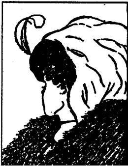
Abbildung 4: Doppeldeutige Frau von Leavitt

Die psychologische Erklärung für diese verschiedenen Sichtweisen ergibt sich aus der Vorstellung darüber, wie ein Mensch mit seiner Umwelt in Kontakt tritt. Die Vorgänge, die dabei ablaufen, werden in drei Bereiche eingeteilt: