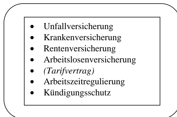
Abbildung 4: Vorhandene Strukturelemente des Normalarbeitsverhältnisses 1939

Abschließend lässt sich anführen, dass im Zuge der Machtübernahme der NSDAP in Deutschland der Staat radikal verändert wurde. Sämtliche Institutionen wurden nach dem Führerprinzip umgebaut und der Arbeitsmarkt gänzlich außer Kraft gesetzt. Nicht Arbeitgeber und Arbeitnehmer, sondern der Staat trat nun als bestimmender Akteur auf und regulierte bzw. diktierte den Arbeitsmarkt nach seinen machtpolitischen Vorstellungen. Trotz aller gravierenden Änderungen auf dem nur noch in Konturen erkennbaren Arbeitsmarkt übernahmen die Nationalsozialisten Struktur und Funktion des bestehenden Systems der sozialen Sicherung und ließen es nach ihrem Machtverlust zurück.