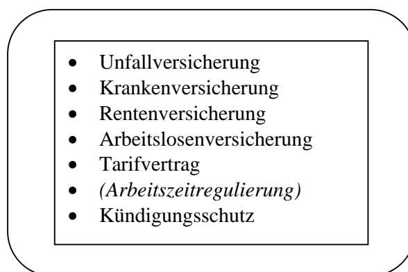
Abbildung 2: Vorhandene Strukturelemente des Normalarbeitsverhältnisses 1927

Bis auf die Arbeitszeitregulierung, die nur von 1919 bis 1923 bestand hatte, können damit im Jahr 1927 sechs der insgesamt sieben strukturellen Merkmale des Normalarbeitsverhältnisses identifiziert werden.