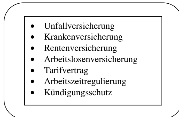
Abbildung 1: Strukturelemente des Normalarbeitsverhältnisses zu Beginn der 70er Jahre des 20. Jahrhunderts

Den theoretischen Rahmen der Untersuchung bildet dabei ein polit-ökonomischer Ansatz, der sich im Wesentlichen mit der Aufteilung der Ressourcen auf die zentralen Akteure innerhalb einer Gesellschaft befasst. Genauer geht es darum aufzuzeigen, wie die einzelnen Akteure agierten, d.h. über welche Ressourcen sie verfügten und welche Interessen wie durchgesetzt werden konnten. Als wesentliche Akteure lassen sich vorab Arbeitgeber, Arbeitnehmer und Staat benennen. Zu den Instrumenten der Arbeitsmarktgestaltung zählen vor allem gesetzliche und vertragliche Regelungen sowie Versicherungen.