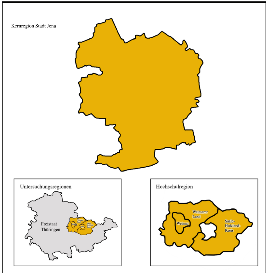
Abbildung 2: Darstellung der Untersuchungsregionen