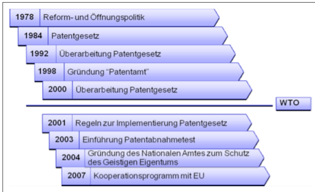
Abb. 1: Entwicklungsprozess Patentrecht