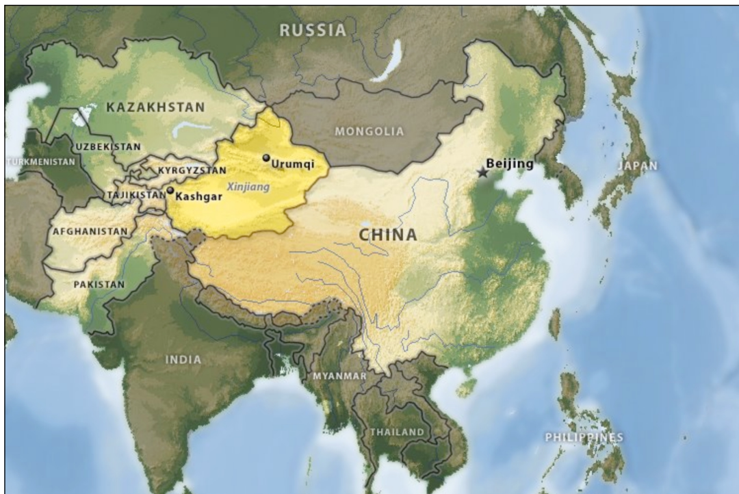
Abb. 1: Karte zur chinesischen Provinz Xinjiang in Zentralasien