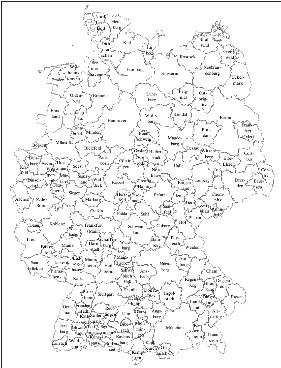
Abb. 3: Arbeitsmarktregionen in Deutschland

Aber die Arbeitsmarktregionen unterscheiden sich nicht nur in der geographischen Ausdehnung erheblich, sondern auch bei der Einwohnerzahl und ausgewählten wirtschaftlichen Größen (vgl. Tab. 3). Die Einwohnerzahl streut zwischen 64.280 und 4.417.028 Personen. Alle Arbeitsmarktregionen erfüllen damit die Anforderungen an die Mindesteinwohnerzahl, die auf 50.000 festgesetzt wurde. Große Diskrepanzen bestehen aber auch beim Bruttoinlandsprodukt (BIP) bezogen auf die Einwohnerzahl sowie der Arbeitslosenquote.