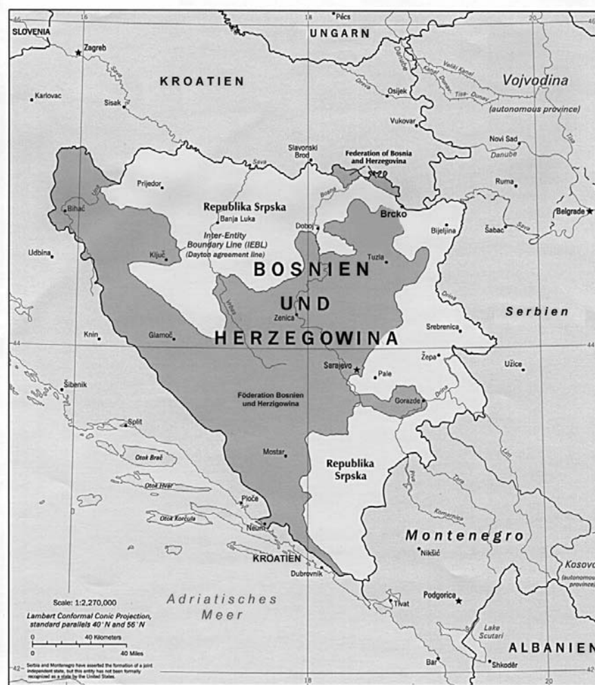
Abbildung 1: Die Entitäten und die „Inter Entity Boundary Line“ in BuH