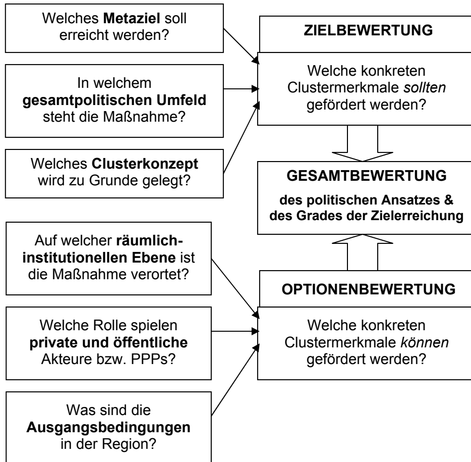
Abbildung 2: Bewertung der Passfähigkeit von Clustermaßnahmen im innovationspolitischen Kontext