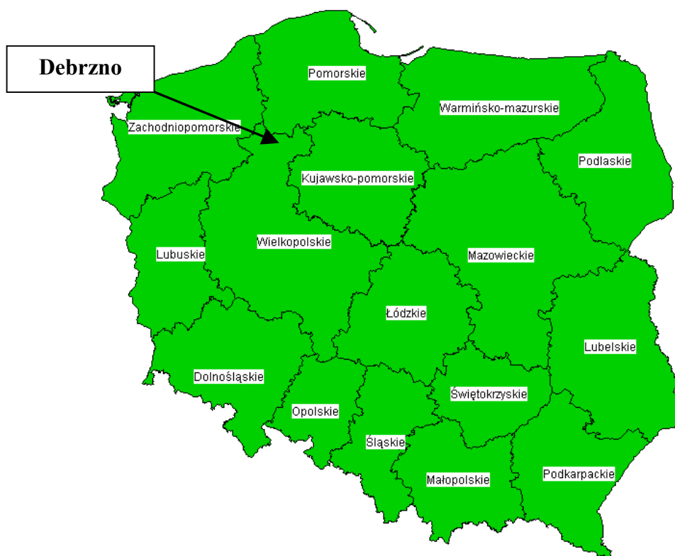
Map 1: Lokalizacja geograficzna Debrzna na mapie województw

Od początku lat 90-tych XX wieku nieprzerwanie rośnie przepaść pomiędzy rozwojem terenów miejskich i terenów wiejskich. Powiększające się różnice w poziomach zarobków i brak perspektyw znalezienia pracy spowodowały już odpływ młodych ludzi ze wsi oraz coraz bardziej zauważalne starzenie się ludności na terenach wiejskich. Inicjatywy lokalne, jak pokazują udane przypadki z różnych regionów Polski, mogą mieć trwały wpływ na rozwój gospodarczy terenów wiejskich i skutecznie przeciwdziałać tym zjawiskom. Niniejsza praca przedstawia wyniki studium przypadku, które zostało przeprowadzone w gminie Debrzna w województwie pomorskim (Map 1). Celem tego studium jest analiza problemów i szans rozwoju lokalnego, inicjatyw lokalnych podejmowanych w celu poprawienia warunków życia w regionie oraz działania podejmowane w celu wdrożenia inicjatywy UE Leader+ w wybranym regionie. Studium przypadku oparte na 35 otwartych wywiadach, które głównie dotyczyły rozwoju regionalnego w ciągu ostatnich piętnastu lat, obejmowały oceny regionalnych problemów i szans z punktu widzenia pytanych, lokalnej mentalności oraz wyników inicjatyw lokalnych podejmowanych przez stowarzyszenie.