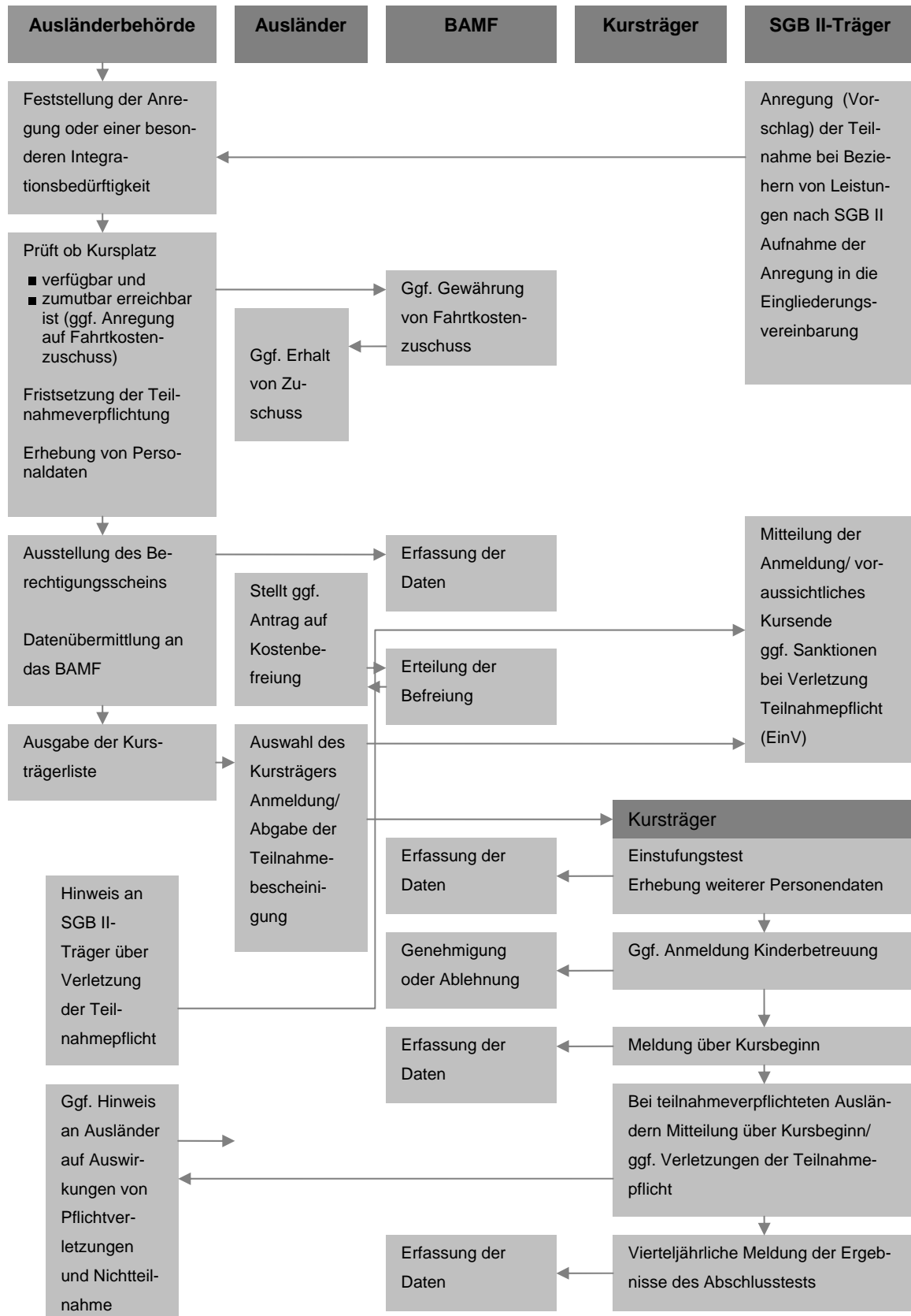
Abbildung 2: Ablaufdiagramm des Integrationskursverfahrens bei Altzuwanderern (verpflichtet) im SGB-II-Bereich