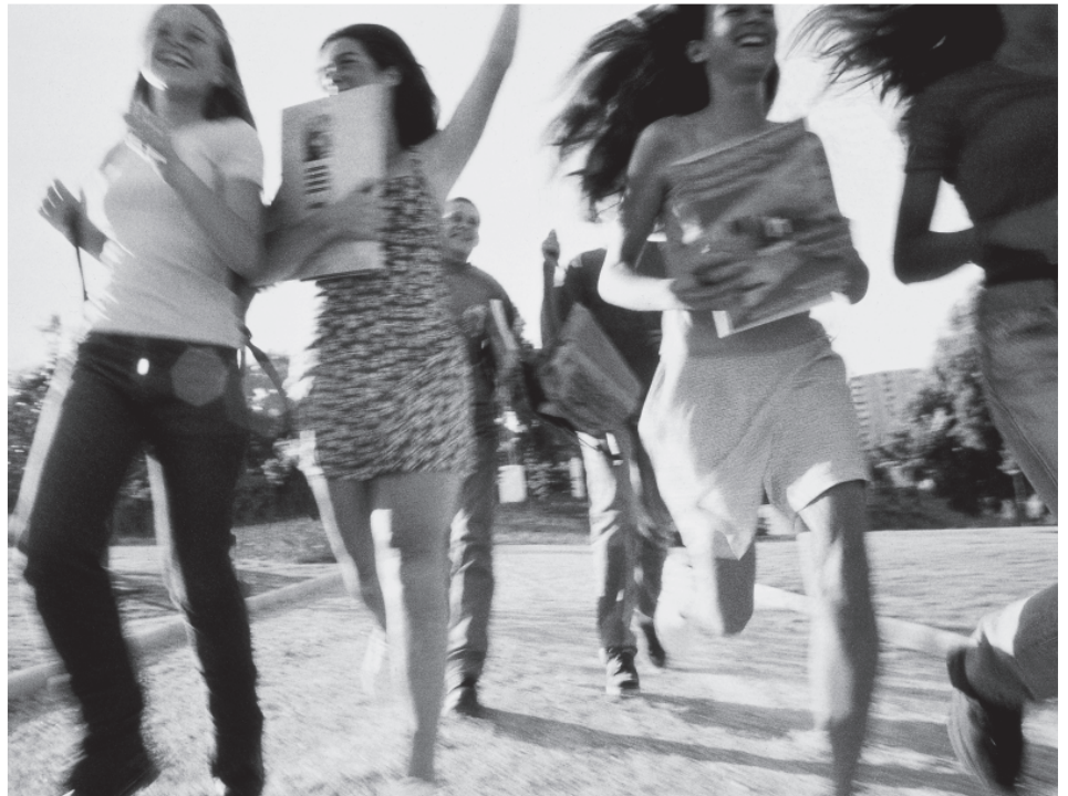
Auch deshalb müssen wir unsere sozialen Systeme reformieren: um den Jüngeren ihre Chancen offenzuhalten

Immer mehr Menschen erkennen inzwischen die Zukunftslosigkeit dieses Ansatzes von Sozialpolitik. Die Reaktion auf den Zustand ist heute geteilt. Die einen klammern sich an Staat und Status quo und suchen in der Politik und in der Interessenlandschaft solche Vertreter, die ihnen dahingehende Versprechungen machen. Die anderen suchen sich aus den Fangarmen dieser Art von Sozialstaat zu befreien und steigen aus. Von Schwarzarbeit über Steuerflucht und neue Arbeitsformen bis hin zum Tätigwerden außerhalb unserer Grenzen gibt es dafür reichlich Möglichkeiten. Dadurch aber wird die Last für diejenigen, die im Land und im System bleiben (müssen), nur noch größer und das, was zur Verteilung übrigbleibt, noch kleiner. Doch das darf nicht das letzte Wort über unsere wirtschaftliche und soziale Zukunft sein.