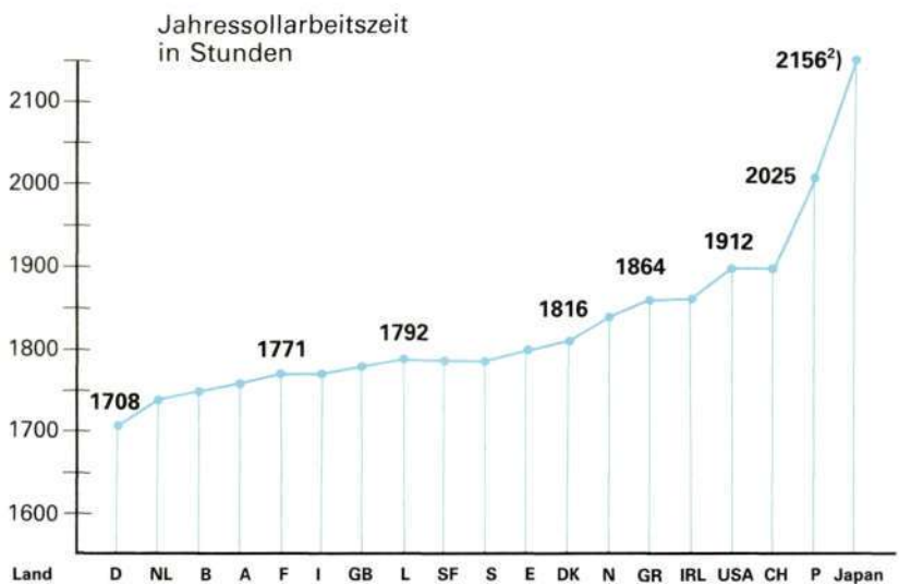
Internationaler Vergleich der tariflichen Jahressollarbeitszeit 1) für Arbeiter des verarbeitenden Gewerbes (Stand 1. 11. 1986)

Aufschlußreich ist die Entwicklung der Arbeitszeit in den ersten drei Jahrzehnten nach Gründung der Bundesrepublik mitsamt den dadurch ausgelösten Reaktionen. Im Verlauf dieser rund 30 Jahre ging die Arbeitszeit in allen Erscheinungsformen, der Tages-, der Wochen-, der jährlichen und der Lebensarbeitszeit pro Jahr durchschnittlich um fast ein Prozent zurück. So erfolgte von 1956 bis 1974 zunächst in der Metall- und Druckindustrie und dann in allen übrigen Branchen der schrittweise