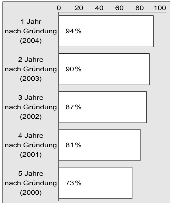
Grafik 1: Selbständigenanteil, nach Gründungsjahr (»Überlebensquote«)