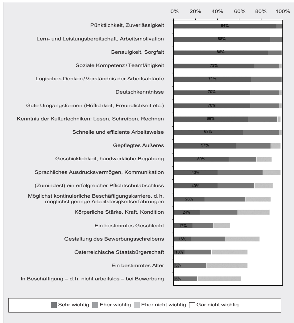
Grafik 2: Wichtigkeit von Kompetenzen bei der Auswahl von formal Geringqualifizierten (Anteil der Antworten von »Sehr wichtig« bis »Gar nicht wichtig«)

Anmerkung: Nur jene 82 Prozent der befragten Betriebe berücksichtigt, die sich zumindest unter bestimmten Umständen eine (zukünftige) Beschäftigung von Personen mit (maximal) Pflichtschulabschluss vorstellen können. Reihung nach der Häufigkeit der »Sehr-wichtig«-Antworten.