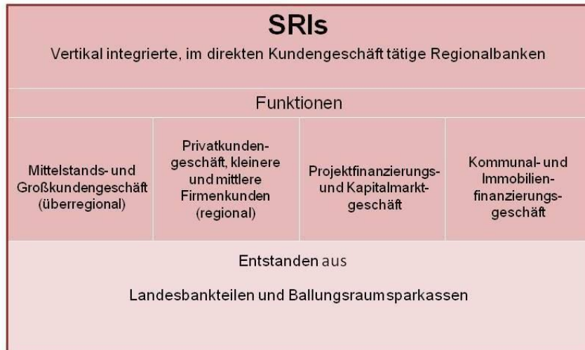
Schaubild 2: Funktionen und Bestandteile der SRIs