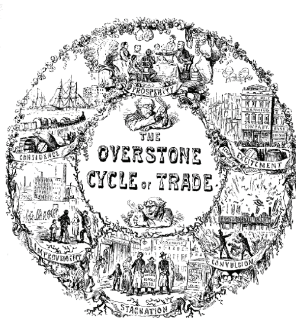
Trade Cycle cartoon, from a print

tipologia delle crisi, che prende le mosse da quella della banca Overend, Guerney & co. nel 1866, preceduta in Inghilterra da almeno due altre serie crisi finanziarie: nel 1825 (quando la stessa Banca d'Inghilterra rischiò il fallimento) e nel 1847 (quando si sgonfiò il boom degli investimenti ferroviari). E' una vignetta che ricostruisce il "ciclo economico" così come visto da un non meglio identificato signor Overstone.