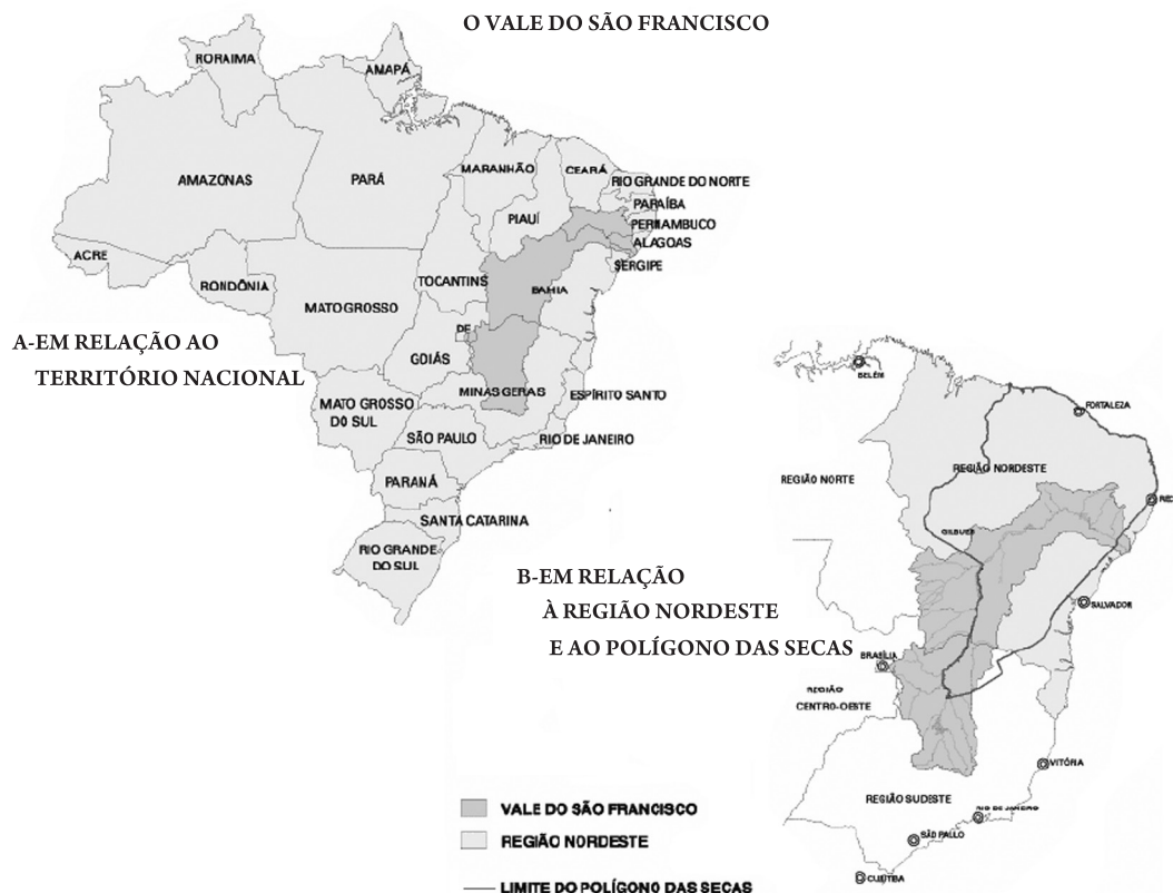
FIGURA 2 O vale do São Francisco e a delimitação do polígono das secas no Nordeste do Brasil