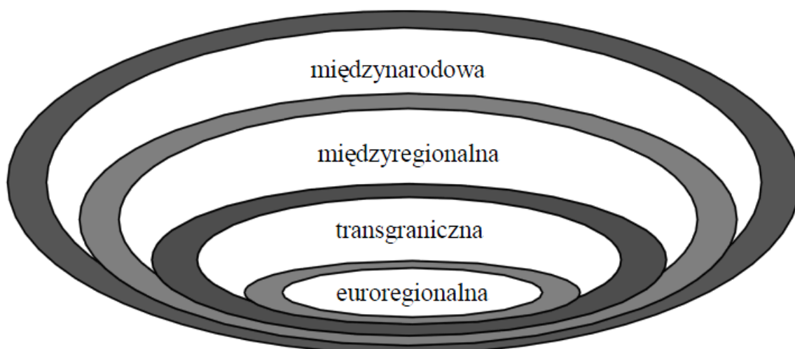
Rysunek 1. Rodzaje współpracy współczesnych państw