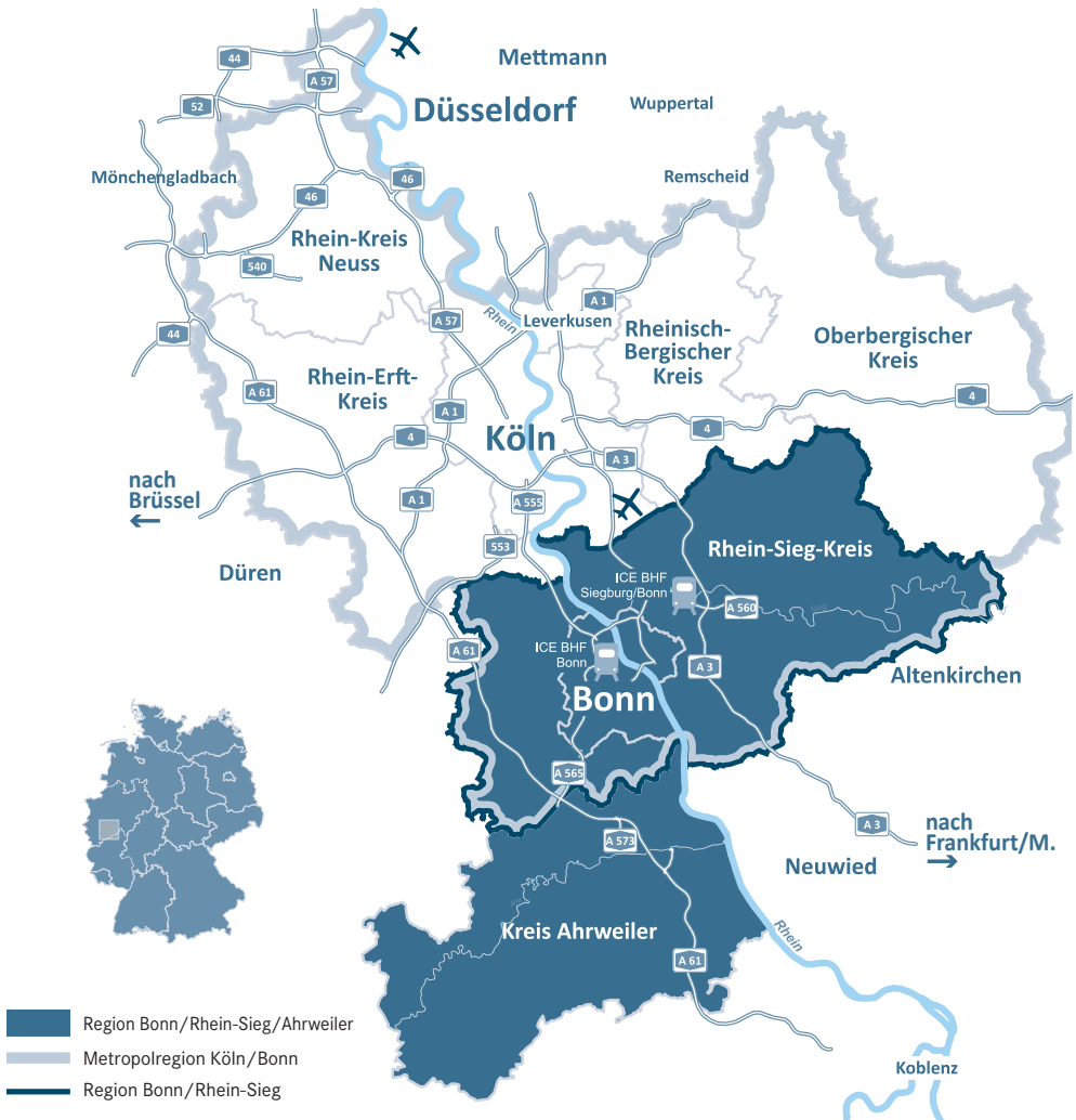
Abb. 1: Räumliche Lage und regionale Kooperationen