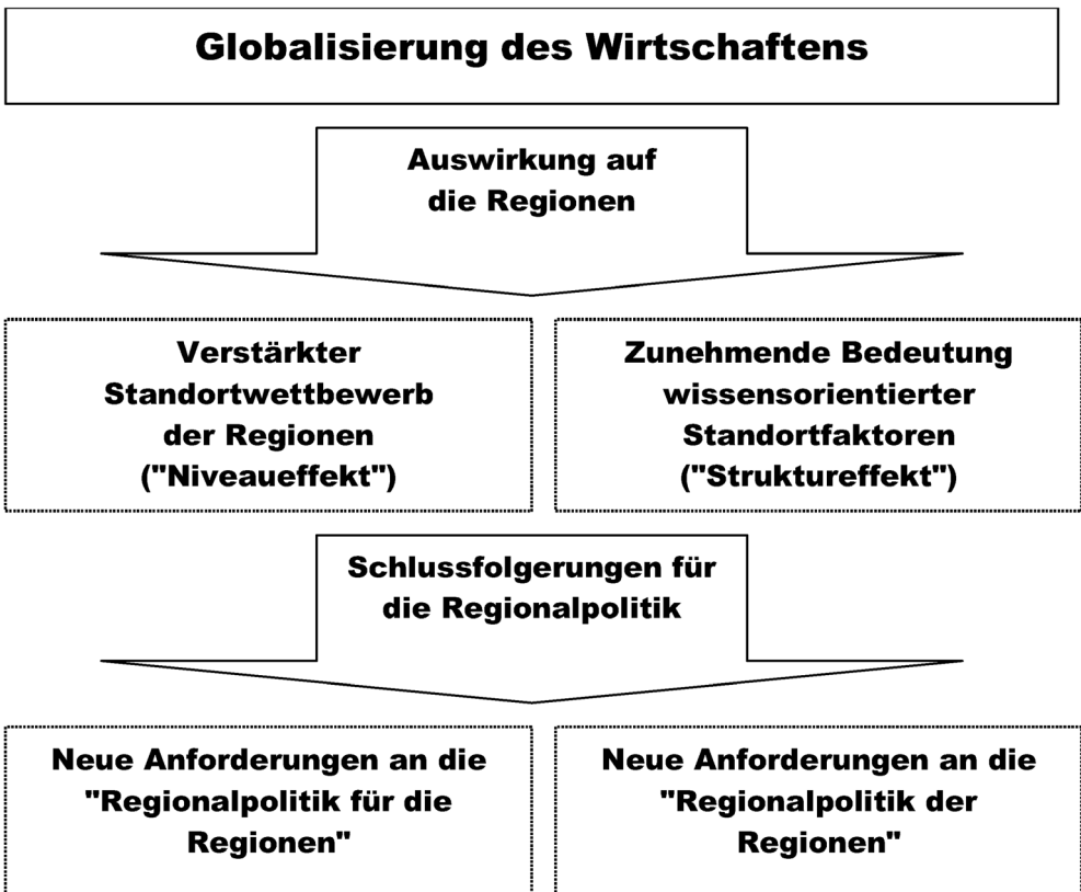
Abb. 2: Die Auswirkung der Globalisierung des Wirtschaftens auf die Ökonomie und Politik der Regionen

ßen, sei es, dass sie mittelbar die Qualität des Angebots der kommunalen und regionalen Unternehmen bestimmen, welche sich vermehrt im internationalen Konkurrenzkampf behaupten müssen. Die verstärkte Wettbewerbsintensität auf den Gütermärkten bei sinkenden Transaktionskosten für unternehmerische Standortentscheidungen führt so zu einem verstärkten Wettbewerb der Regionen um mobiles Kapital (Ansiedlungspolitik) und die Qualität des Angebots der bestehenden regionalen Unternehmen (Bestandspflege).