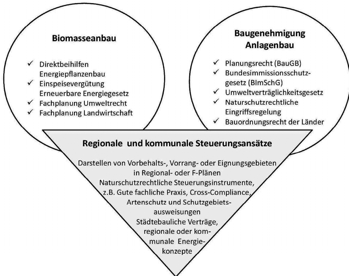
Abb. 1: Steuerungsmöglichkeiten bei der Erzeugung und Verarbeitung von Biomasse zur Energieerzeugung durch Gesetze und staatliche Förderungen

prozessualer Planung und Aushandlungsprozesse zwischen staatlichen und nicht-staatlichen Akteuren sowie der Bedarf einer besseren Abstimmung zwischen Planungs- und Fachrecht zunehmend an Bedeutung (vgl. Abb. 1). Der vorliegende Beitrag setzt sich zum Ziel, den Handlungsspielraum der Steuerung der Anlagenplanung durch die rechtlichen Rahmenbedingungen (räumliche Planung und Fachplanung insbesondere auf Ebene der Bauleitplanung) sowie ergänzende Einflussmöglichkeiten informeller Planungen aufzuzeigen.