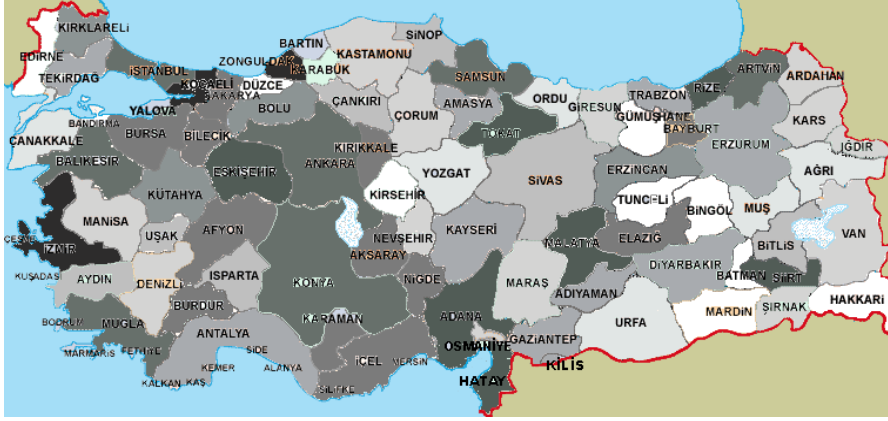
Harita 11: Kişi Başına Gerçek Kamu İmalat Sanayi Katma Değeri 1980-1990