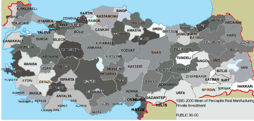
Harita 6: Kişi Başına Gerçel Kamu İmalat Sanayi Yatırımı 1990-2000