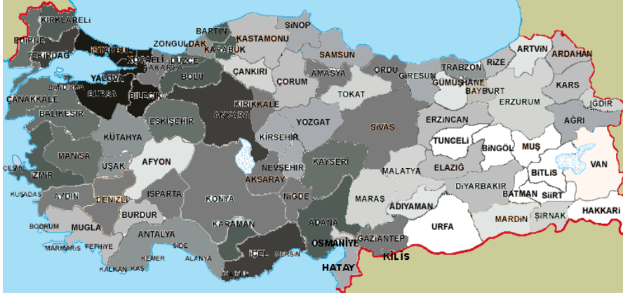
Harita 8: Kişi Başına Gerçel Özel İmalat Sanayi Katma Değeri 1980-1990