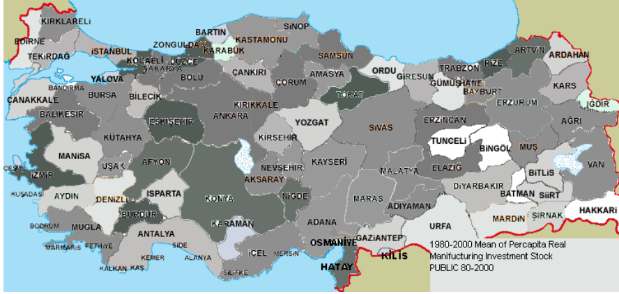
Harita 4: Kişi Başına Gerçel Kamu İmalat Sanayi Yatırımı 1980-2000