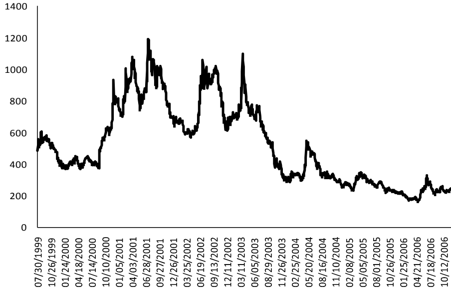
Şekil 1. Türkiye'nin Kredi Riski (EMBI farkı, 30 Temmuz 1999-26 Aralık 2006)