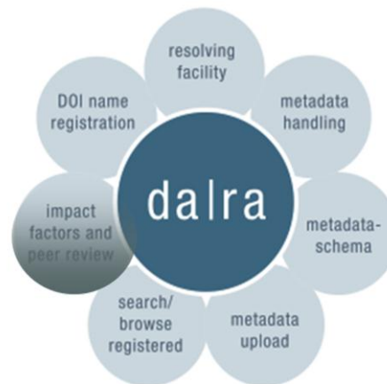
Abb. 2: da|ra Services

Die Registrierungsagentur da|ra bietet eine vollständige Infrastruktur für die DOI-Registrierung und die Metadatenverwaltung. Die Betreiber von da|ra sehen sich als Dienstleister für Daten- und Forschungszentren, die ihre Primärdaten mit DOI-Namen registrieren wollen. Dabei kann es sich um Surveydaten, Aggregatdaten, Microdaten aber auch um qualitative Daten handeln.