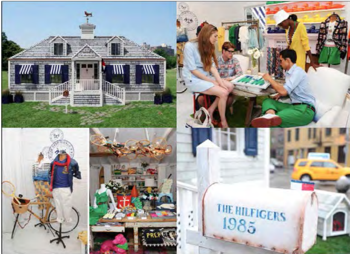
Abbildung 3: „Prep World“ Pop-up-Store Tournee, Frühjahr/Sommer 2011

Die Fotos in Abbildung 3 zeigen das mobile Haus, das eigens für die Pop-up-Store Tournee von internen Designern als typisches ostamerikanisches Strand-Cottage mit grünem Rasen, weißem Gartenzaun und Hundehütte gestaltet wurde.