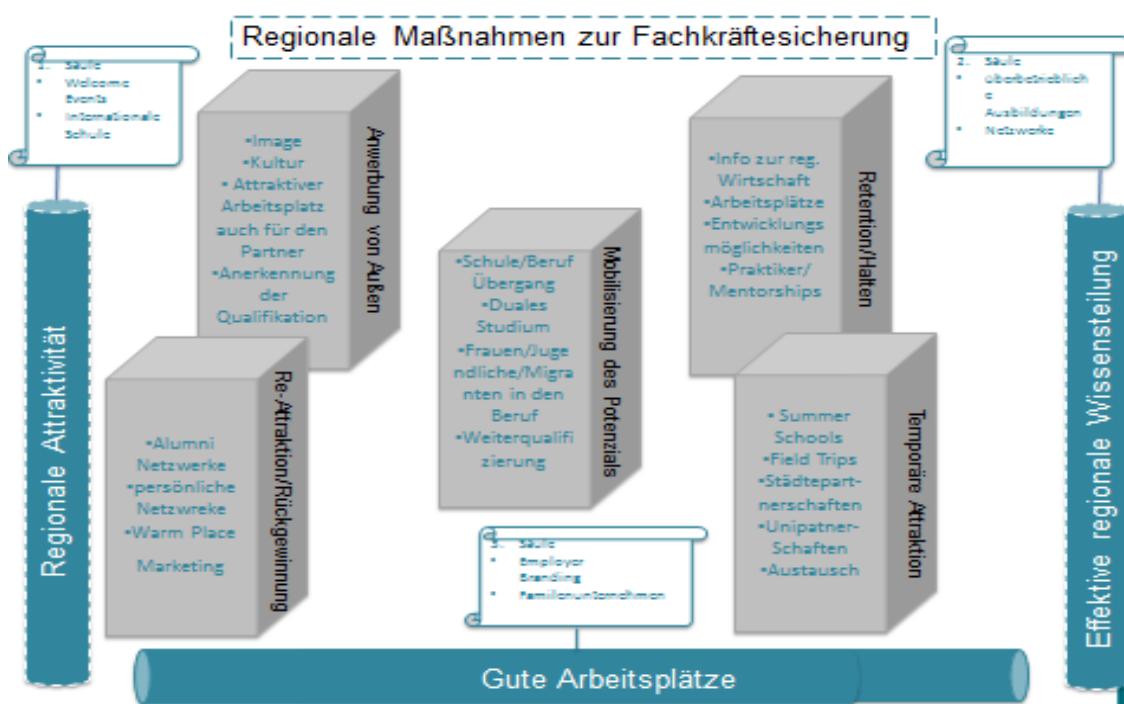
Abb. 4: Regionale Fachkräftesicherung - Maßnahmen

Das vierte Handlungsfeld besteht darin, Menschen, die einmal die Region verlassen haben, zurückzugewinnen. Es kann nicht das Ziel sein, alle Arbeitskräfte in der Region zu halten. In einer offenen Ökonomie ist es wichtig, dass Menschen rausgehen, Neues lernen, neue Impulse erhalten und dann auch zurückkommen. In diesem Handlungsfeld können z.B. Alumni-Netzwerke, nicht nur von Hochschulen sondern auch von Schulen, eine große Rolle spielen. Wichtig ist dabei, dass die Menschen gute Erfahrungen in der Region gemacht haben, hier wird von „warm place marketing“ gesprochen. Wenn sie in der Ausbildung gut betreut wurden, dann ist die Chance, dass sie zurückkommen, auch höher.