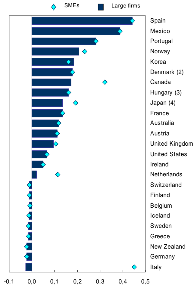
Kuva 2 Verokannustimen* merkitys yritysten T&amp;K-toiminnassa vuonna 2004