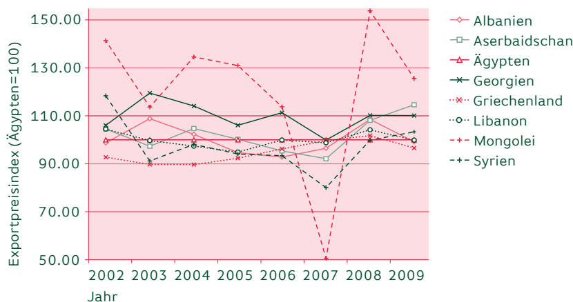
Abbildung 2: Relative russische Exportpreise (fob) für Weizen anhand ausgewählter Exportländer, 2002–2009 (Ägypten = 100)

Anmerkung: Alle Weizenexportpreise (in US-$ pro Tonne) wurden in Relation zu den Exportpreisen nach Ägypten gesetzt, da der ägyptische Markt von Marktkennern als sehr transparent und wettbewerbsintensiv eingestuft wird. Ägypten dient somit als Benchmark.