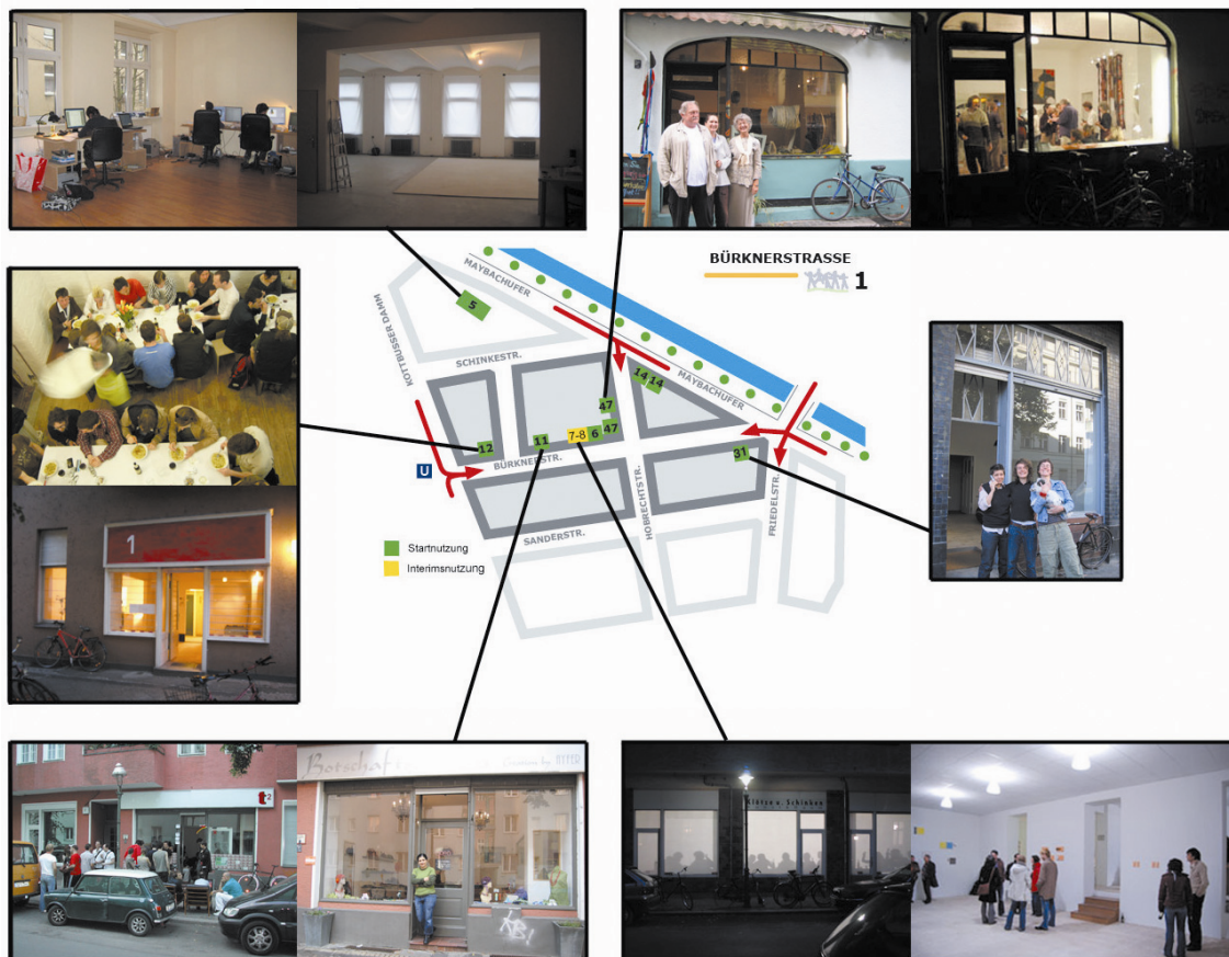
Abb. 3: Neue Nutzungen am Mikrostandort Bürknerstraße 2007

Auf der lokalen Handlungsebene dienen strategische Überlegungen zu Clusterstrukturen und Wettbewerbsvorteilen dazu, zum einen die angesiedelten Unternehmen langfristig in die ökonomische Tragfähigkeit zu überführen. Zum anderen bieten diese Strukturen gute Voraussetzungen, um lose Netzwerke und Kooperationen aufzubauen. Die Entwicklung und Konzeption von Mikrostandorten ist ein wichtiges Instrument, um wettbewerbsfähige Umfeldbedingungen zu schaffen (vgl. Abb. 3). Ein dichtes räumliches Netz an Nutzern wird durch die kompakte Ansiedlung in unmittelbarer Nähe zueinander aufgebaut (vgl. Meyer-Stamer 2000).