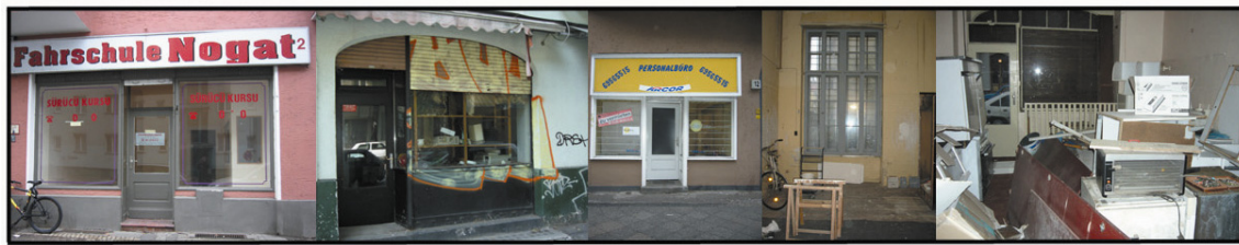
Abb. 2: Ladenleerstand in der Bürknerstraße zu Projektbeginn 2005