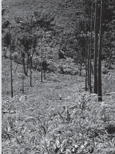
Abbildung 3: Anpflanzung von Cordia aliadora mit Mais im Taungya System in der Canadas Region von Chiapas, Mexiko. Gus Hellier, 2001.

Die Vermittlung zwischen Produzenten und Käufern obliegt einem »Trust Fund«, dem die Verwaltung, ein Team für die soziale Betreuung sowie ein technisches Team angehören.