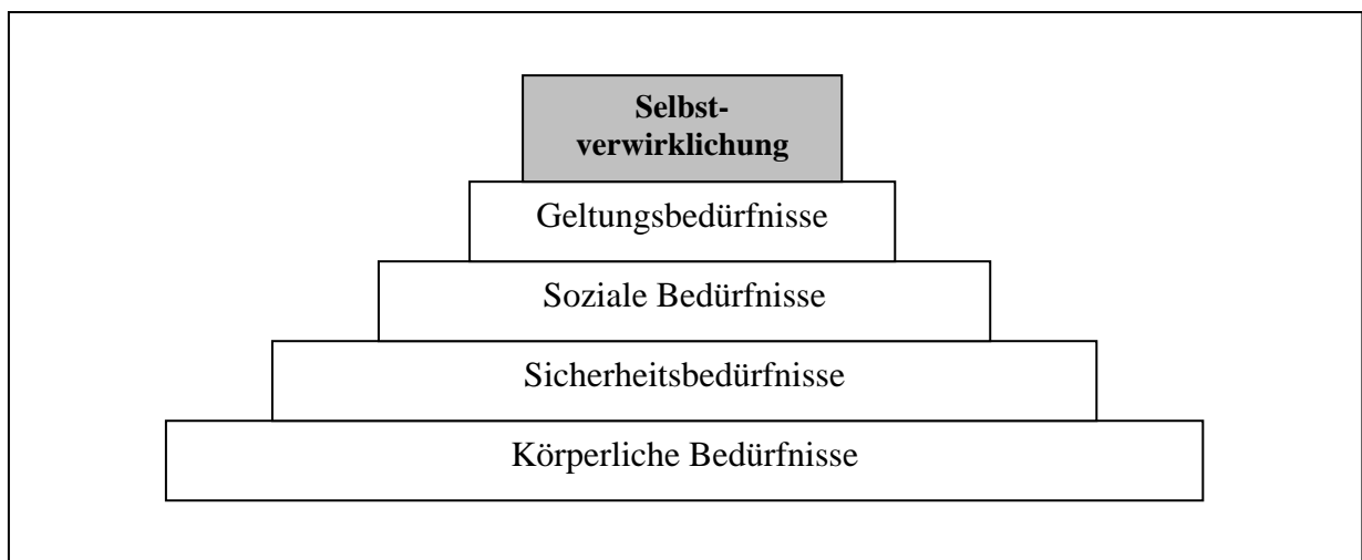
Abb. 1: Die Bedürfnispyramide nach Maslow In Anlehnung an: Stangl (2006), o.S.; Green (2000), S.370

Erst wenn die Basisbedürfnisse befriedigt sind, strebt der Mensch nach der Erfüllung der nächsten Stufe – bis an der Spitze die individuelle Entfaltung seiner selbst bzw. in griffigeren Worten "das Glück" steht.