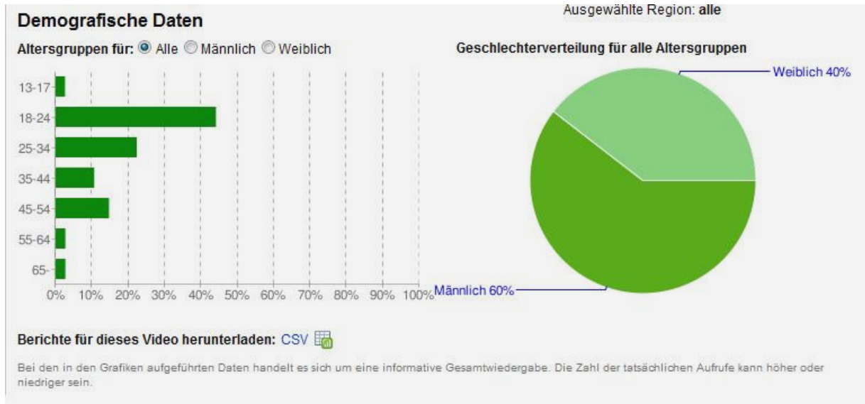
Abbildung 4: Altersgruppen der Aufrufer des ESB-Flashmobs

Die vom ESB-Flashmob angesprochene Altersgruppe liegt nach YouTube-Statistiken der ESB-PR-Abteilung mit über 40% zwischen 18-24 Jahren (vgl. Abbildung 4) und entspricht damit genau der Zielgruppe für angehende Studenten oder Studiengangwechsler.