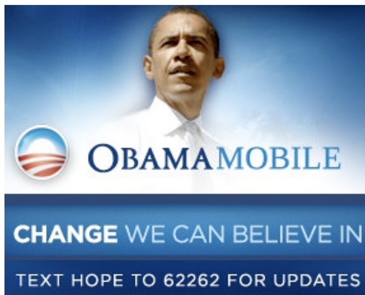
Abbildung 5: Obama Mobile

Ein weiteres wichtiges Kommunikationsinstrument von Barack Obama ist das Versenden von SMS. Sowohl E-Mails als auch SMS beinhalten am Ende der Botschaft die virale Aufforderung "please forward this message", um die Leute zur Verbreitung des Inhalts anzuregen. Da die Empfangsrate bei fast 100% liegt und jeder eine SMS öffnet, sobald er sie empfängt, haben SMS gewisse Vorteile gegenüber anderen Kommunikationsinstrumenten. Außerdem haben die meisten Menschen ihr Handy in allen Lebenssituationen bei sich und sind daher jederzeit erreichbar. Diese Vorgehensweise des Guerilla Mobile 41 ist eng verbunden mit dem Viralen Marketing. Anhänger können sich per SMS für den Obama-Newsletter anmelden und jederzeit aktuelle Nachrichten per SMS bekommen, wie in Abbildung 5 zu sehen ist.