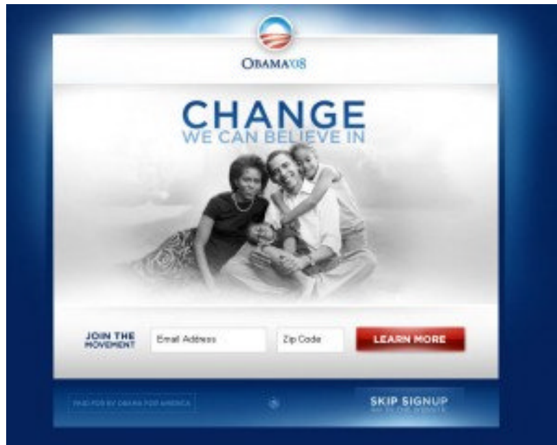
Abbildung 4: Newsletter von Barack Obama abonnieren

keit. Auf diese Weise hat Barack Obamas Team ohne großen Aufwand potenzielle Übermittler von viralen Botschaften und viele neue Abnehmer des eigenen Newsletters gewonnen. Wie in Abbildung 4 zu sehen ist, werden Elemente wie "Learn More" oder "Donate Now" in Rot gehalten, um sich vom Rest der Webseite gezielt abzuheben.