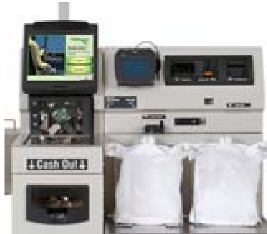
Abb. 4: Self-Checkout-Terminal