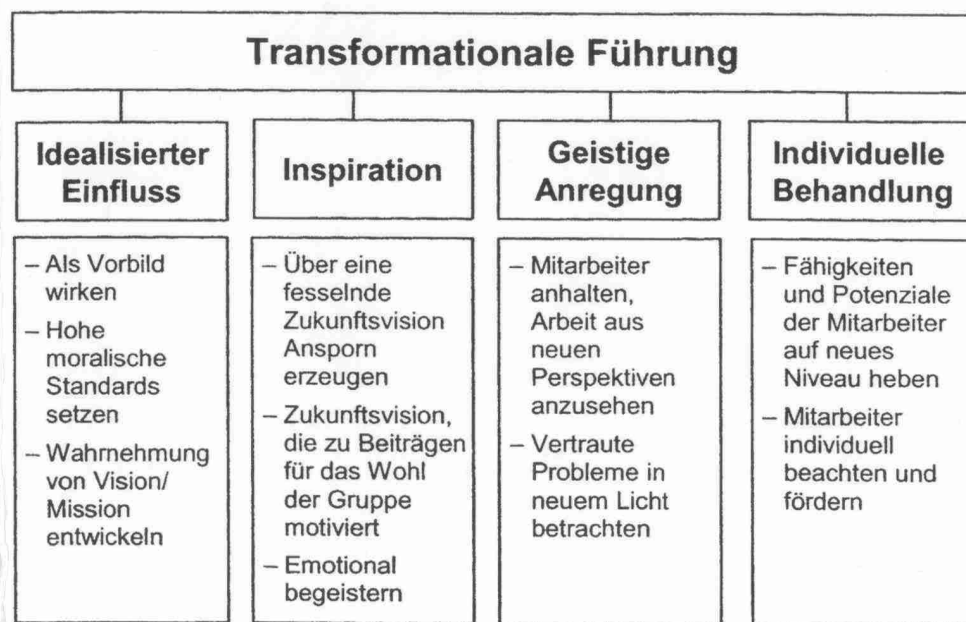
Abbildung 6: Transformationale Führung (aus: Bruch/Vogel, 2005, S. 129) 3

Die „Transformationale Führung“ nach Bass, 1985 (Abb. 6), postuliert beispielsweise als Führungsstil Anforderungen an das Managementverhalten, die es ermöglichen, Wertschätzung zu etablieren (z.B. durch „individuelle Behandlung“).