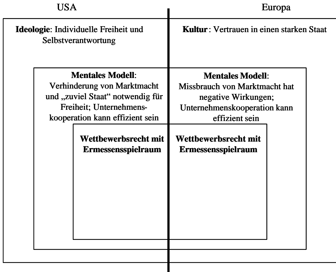
Abb. 3: Institutionensystem der Wettbewerbspolitik bis heute

Trotz dieser Angleichung kommt es zu Meinungsverschiedenheiten in Einzelfällen. Begründungen können in der Einflussnahme von Interessengruppen oder allgemein in eigennutzorientierten Handlungen der beteiligten Akteure liegen. Wenn Wettbewerbsbeschränkungen vorliegen, können diese auf unterschiedliche Art und Weise ausgelegt und beurteilt werden. Die Gewichtung fällt dann häufig zu Gunsten heimischer Unternehmen aus. Basedow kommentiert diese Beobachtung: 129