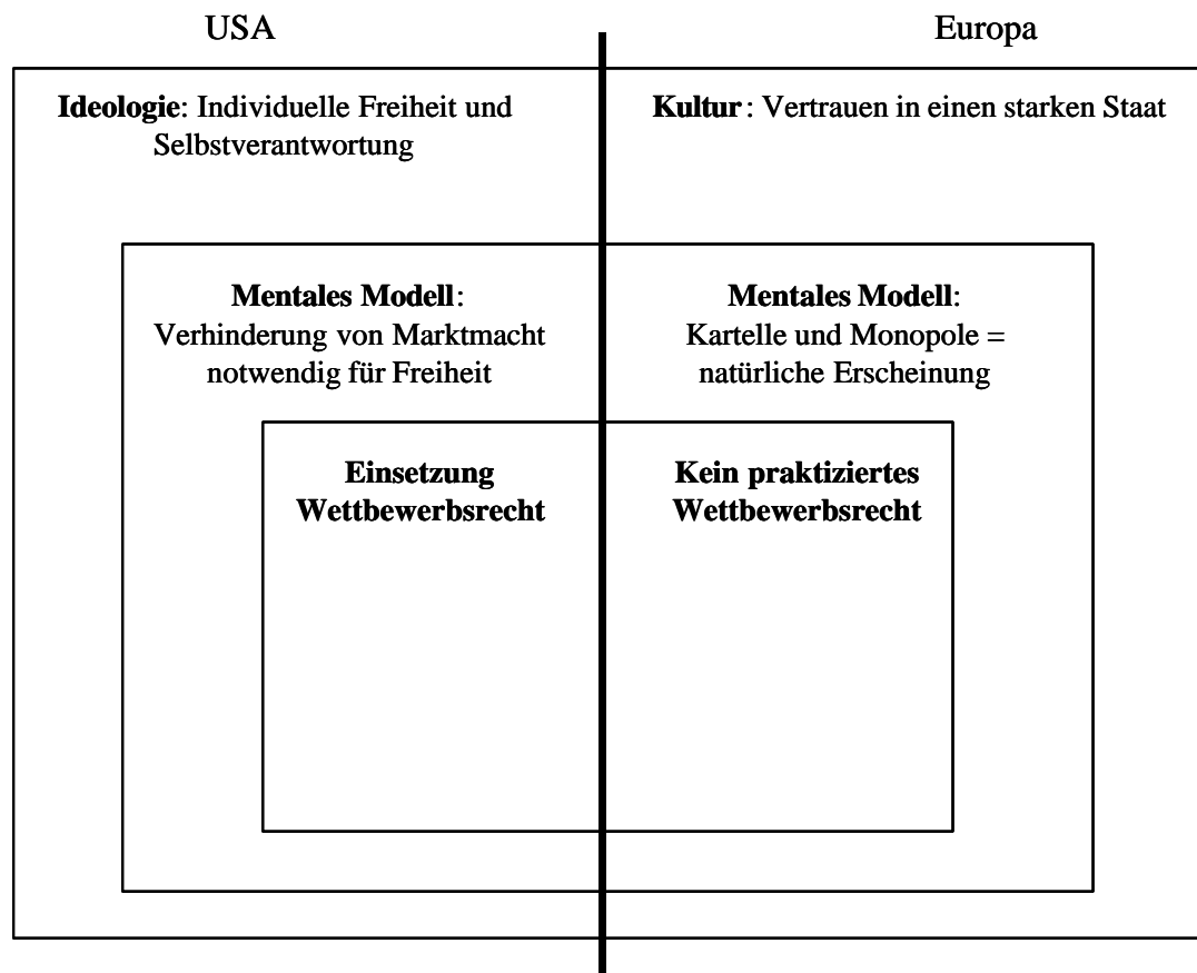
Abb. 1: Institutionensystem der Wettbewerbspolitik bis 2. Weltkrieg

Konklusion: Durch die Ideologie der amerikanischen Bevölkerung war die Entwicklung der Wettbewerbspolitik pfadabhängig vorgegeben. In Europa fehlte eine solche Ideologie. Zwei völlig divergente Pfade der Wettbewerbspolitik wurden eingeschlagen.