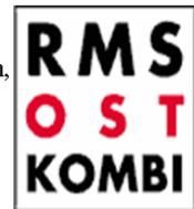
Abb. 2: Die RMS als überregionaler Hörfunkvermarkter (www.rms.de, Abfrage 04.04.2009)

-ANTENNE MECKL.-VORP. -R.SA -radio SAW -ENERGY Sachsen -ROCKLAND -ANTENNE THÜRINGEN -RADIO PSR -radio TOP 40 -LandesWelle